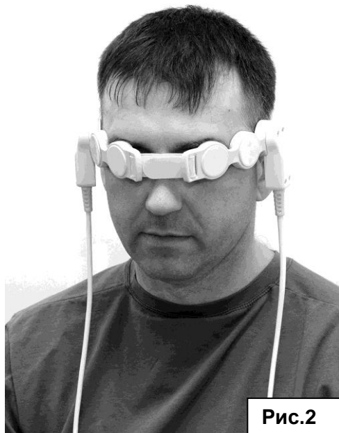
Рисунок 2. Лечение проводится по методике Программы №3 (задаётся цифра «3»). Курс лечения

Методика лечения. Оголовье размещают «N» (северной) стороной к голове таким образом, чтобы индукторы №1 (см. Руководство по эксплуатации) каждой излучающей линейки располагались на затылочной области, далее индукторы проходят по ушным раковинам, а индукторы №6 устанавливаются на глаза.